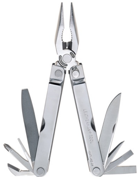
POCKET SURVIVAL TOOL®

Természetesen egy különálló célszerszámokból álló szerszámkészlettel gyorsabb, és könnyebb is a munka, csak hát ugye, súlya és mérete folytán ilyen készlet nem lehet mindig kéznél, a multiszerszám viszont igen.